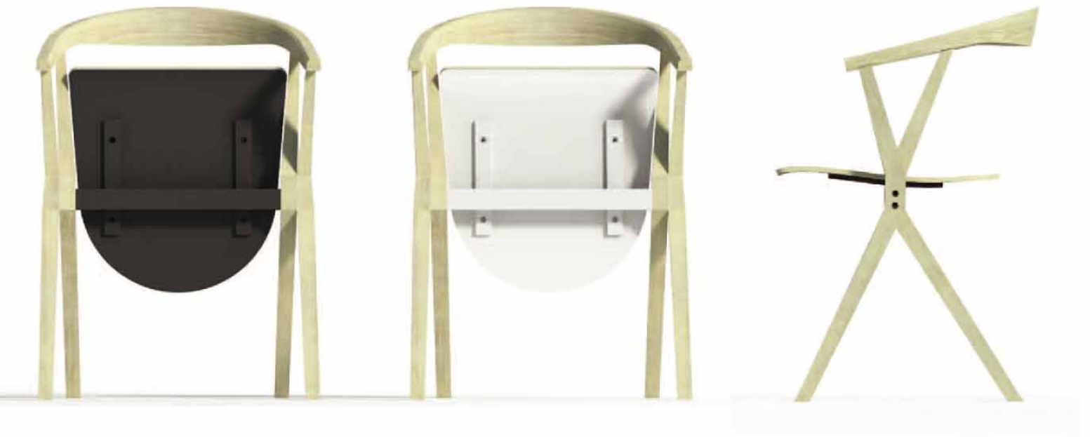
Detalle de la versión con asiento tapizado en piel.