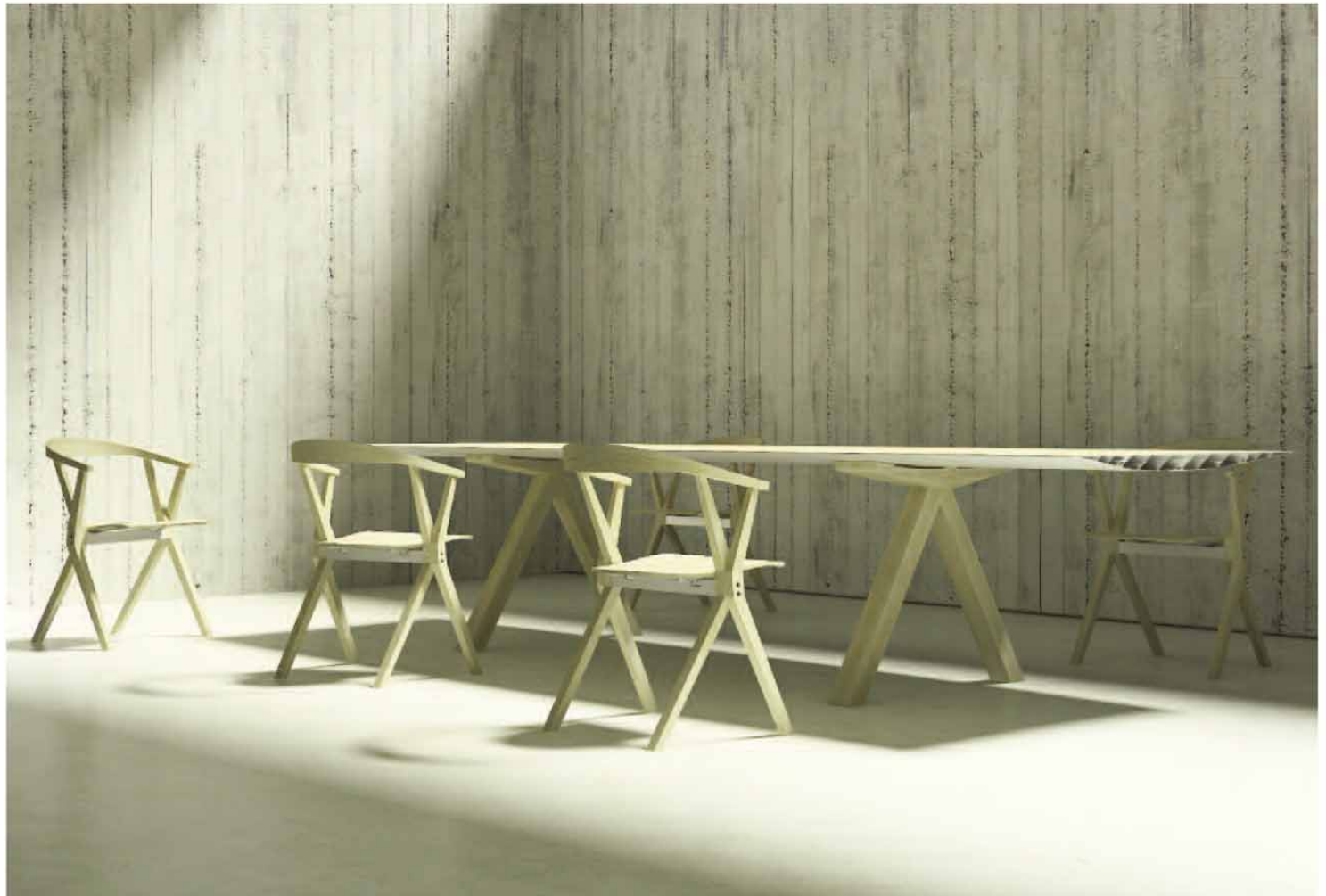
Table B mit passenden Stühlen.