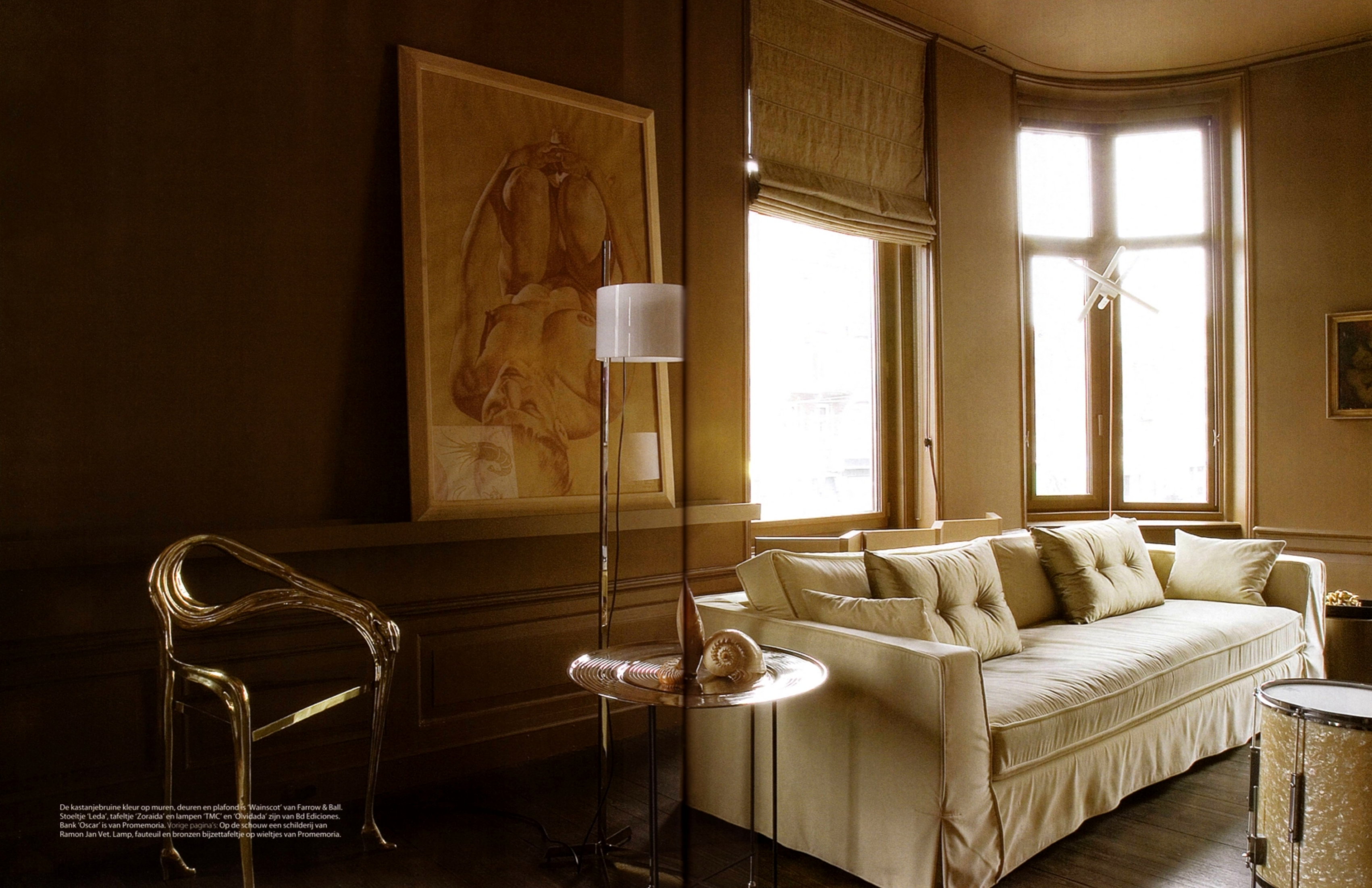
De kastanjebruine kleur op muren, deuren en plafond is 'Wainscot' van Farrow & Ball. Stoeltje 'Leda', tafeltje 'Zoraida' en lampen 'TMC' en 'Olvidada' zijn van Bd Ediciones. Bank 'Oscar' is van Promemoria. Vorige pagina's: Op de schouw een schilderij van Ramon Jan Vet. Lamp, fauteuil en bronzen bijzettafeltje op wieltes van Promemoria.