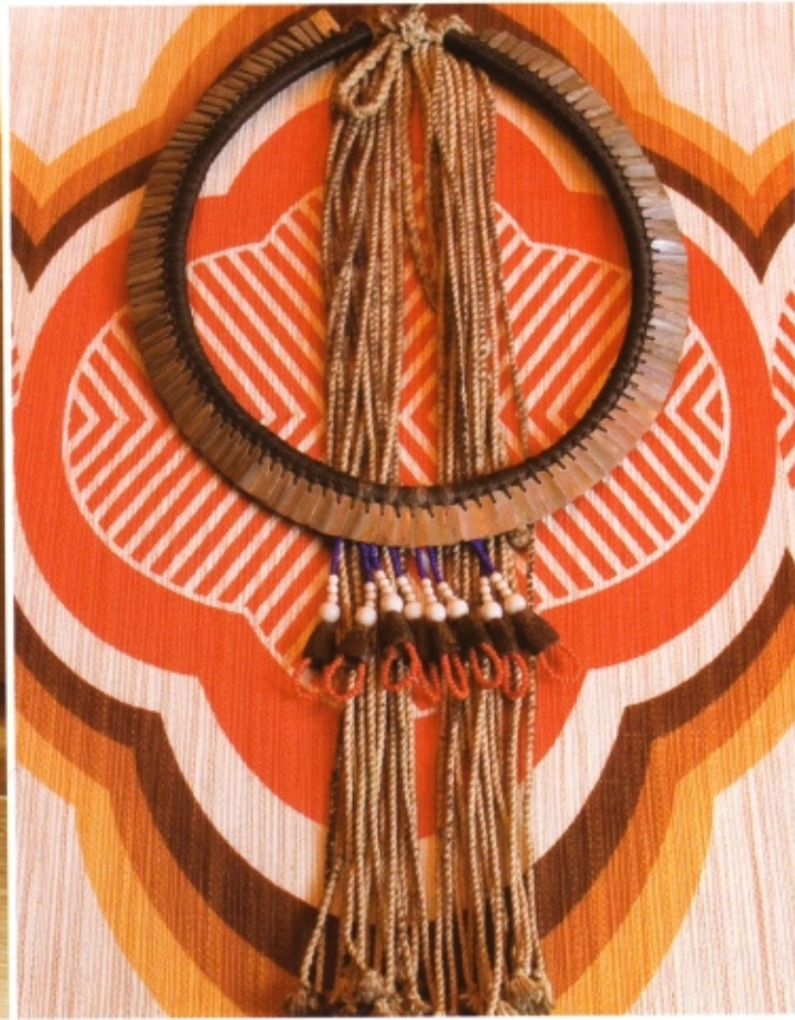
Met de klok mee: In de gang het met roze leer beklede stoeltje 'Bilou Bilou' van Promemoria en een altaartje dat Iris meenam uit Vietnam. Braziliaanse ketting, souvenir van één van haar reizen, op een rokje van Miu Miu. In de keuken stoelen 'Valentino' van Promemoria, bekleed met purperkleurig fluweel. De tafel is van een brocanterie in de buurt. Erboven hangt lampje 'Absolut' van Vest. Lekkernijen op een schoteltje uit het serviesje dat de kleine Iris kreeg voor haar Eerste Communie. De bronzen schaal komt uit de collectie van Promemoria. Rechterpagina: Alle meubelen en lampen zijn ontworpen door Romeo Sozzi voor Promemoria, behalve kroonluchter 'Vague Stelle' van B.D.