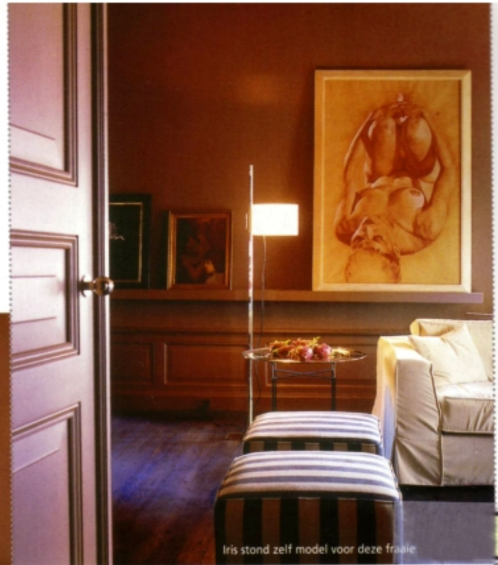
Iris stond zelf model voor deze fraaie