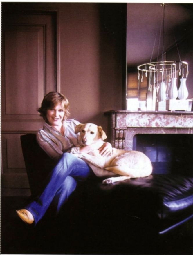
Heneka en Doortje: liefde op het eerste gezicht. Zwartleren chaise-longue Aziza van Promemoria.