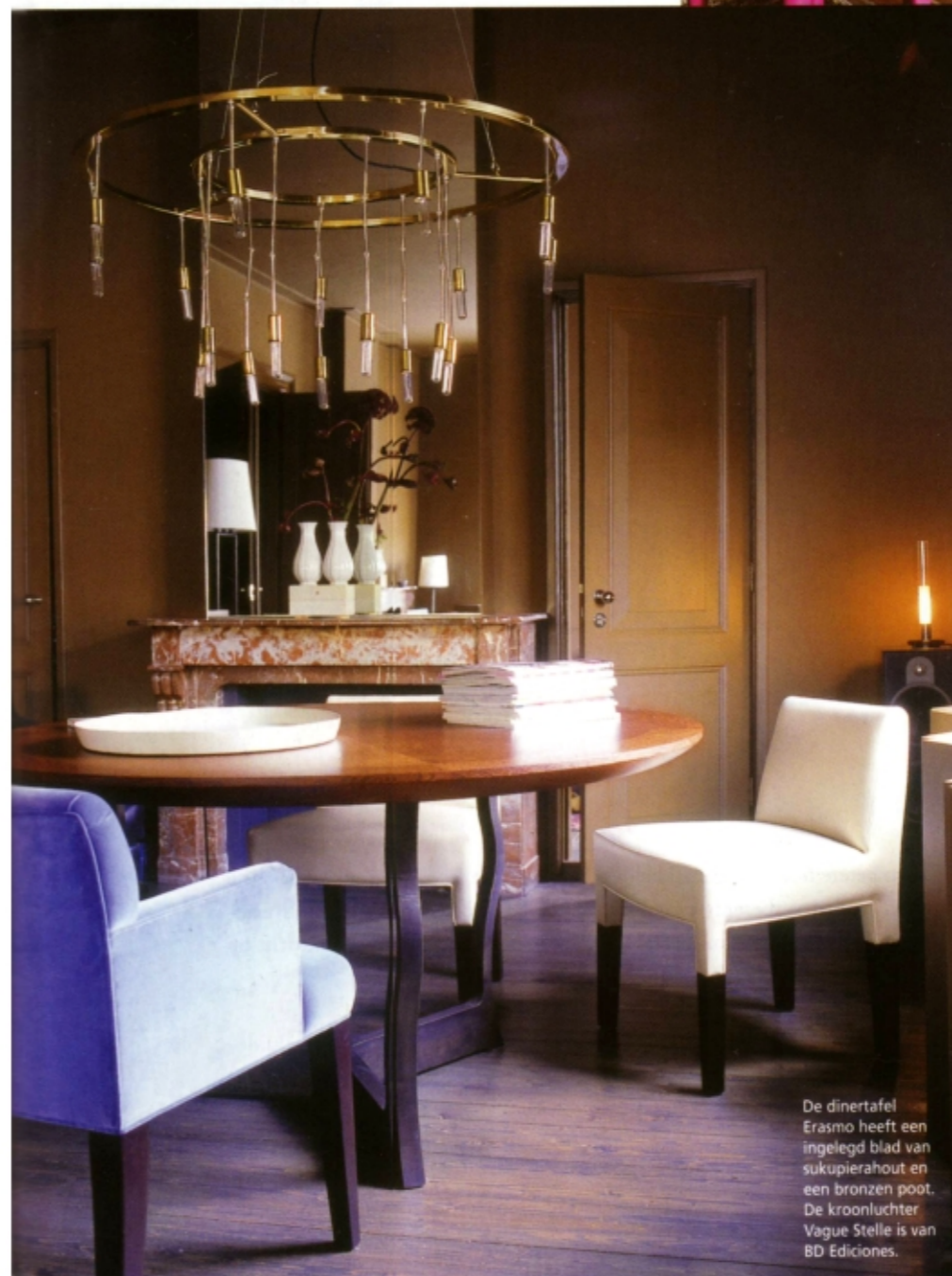
De dinertafel Erasmo heeft een ingelegd blad van sukupierahout en een bronzen poot. De kroonluchter Vague Stelle is van BD Ediciones.

weinig, maar elke keer pakken we de draad weer moeiteloos op.'