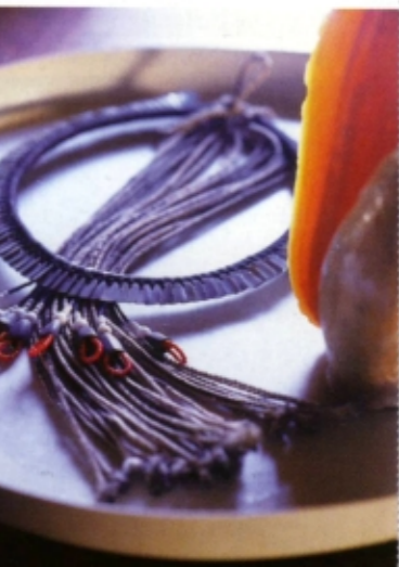
De etnische ketting werd meegebracht van een reis naar Brazilië. De schelp is een souvenir uit Gambia. Schaal Maxi Tray van Wolterinck.