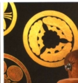
Detail in lederwerk van ProMemoria.