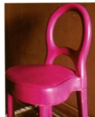
Stoel Bilou Bilou van Promemoria is met fuchsiaroze kalfsleer bekleed.